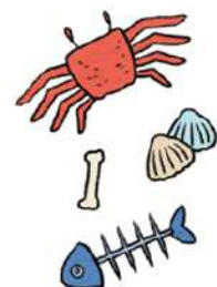
동물 뼈, 생선 뼈, 조개·굴·게 껍질