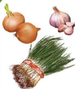
파, 마늘, 양파 등의 뿌리나 껍질