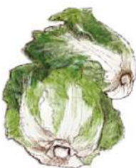
흙 묻은 배추 겉잎