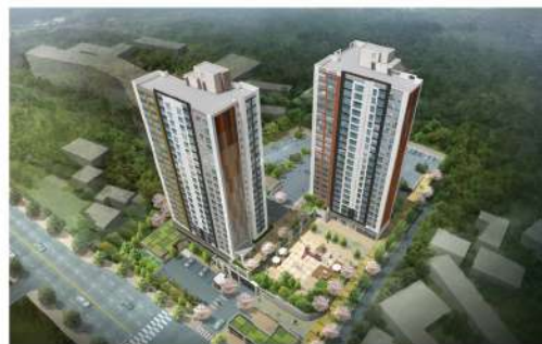
목포용해5 행복주택 16㎡·26㎡·36㎡·44㎡ 총400호