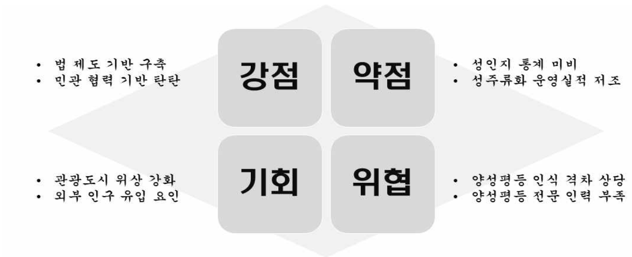
[그림 II-1] 목포시 양성평등정책 SWOT 분석